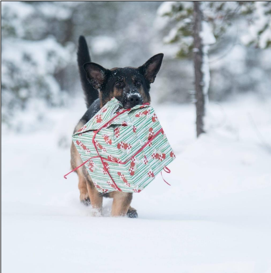
Heldige Bjørnulvs Twist fant den store pakken