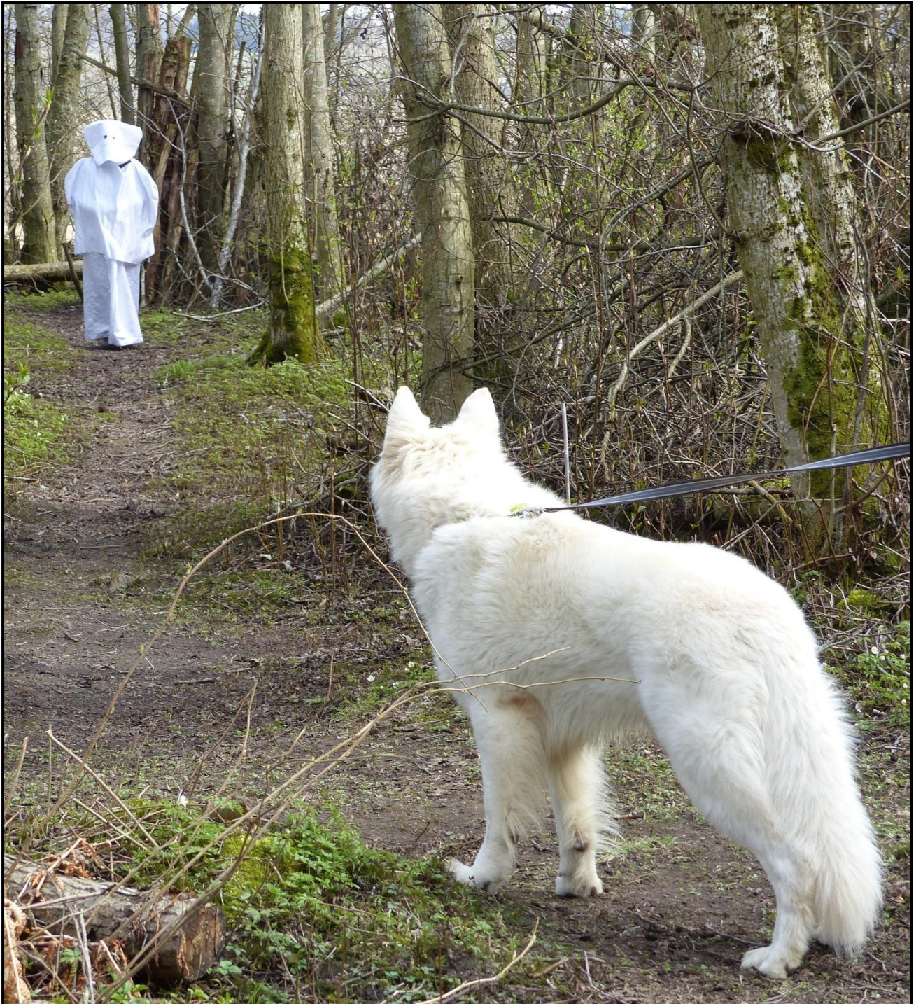
Spøkelser i skogen