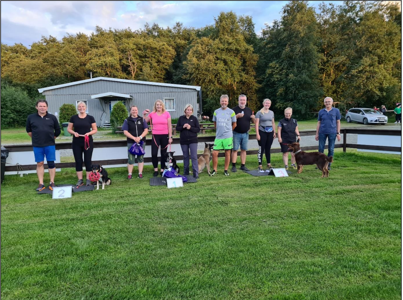
«Large lagene» fra Nidaros på pallen fredag 21. august.