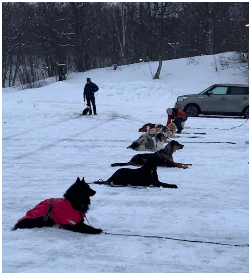
Bilde fra årets første utendørstrening på Dragvoll