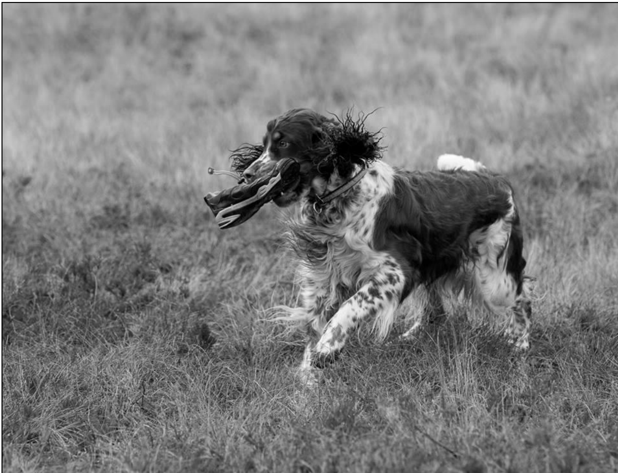
Hera har funnet gjenstand!

Så begynte treningen. I første runde var hovedmålet å sjekke utgangspunktet til hver enkelt ekvipasje. Ellinor er svært dyktig til å observere hver enkelt hund og å "tenke høyt" slik at også kursdeltakerne kunne følge tankerekken og bli med på å legge opp strategier for resten av helgen. Med ulike utgangspunkt og ulike mål ble derfor treningen individuelt skreddersydd for resten av helgen.