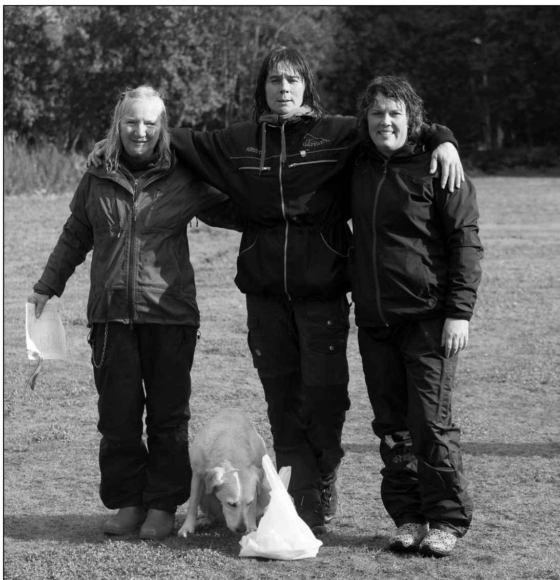
Vinnere klasse Elite