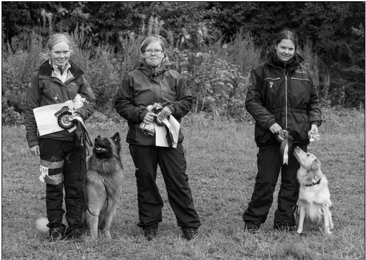
Vinnere klasse 2