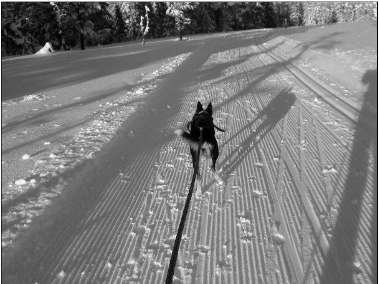
Denne usikten er perfekt ☺