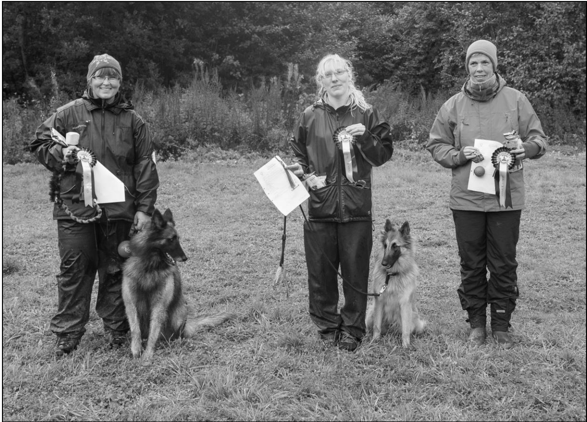
Vinnere klasse 1