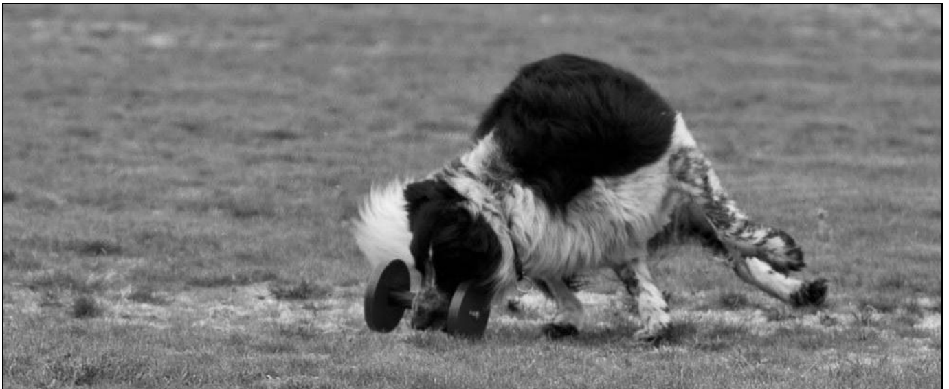
Tin-Tin gir alt når den 4 kilo tunge apporten skal hentes

Dommere, øvingsledere og alt hjelpemannskap kommer alle fra forskjellige deler av landet, alle for å gi av sin tid og resurser for å være med på "verdens største dugnad".