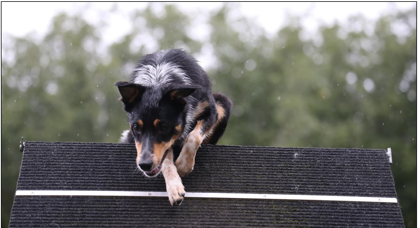
Tiinii på vei over mønet