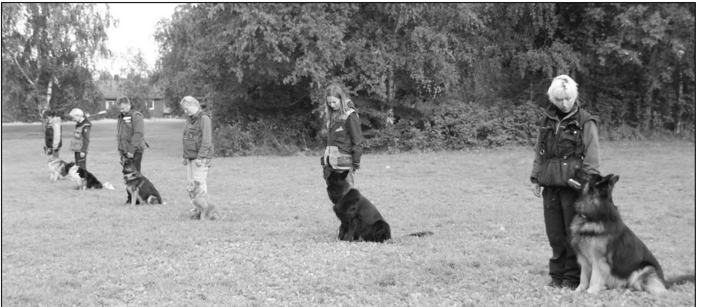
Klart for fellesdekk