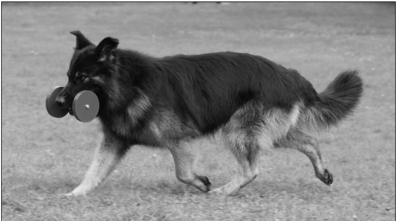
Argo med 4 kilos apporten