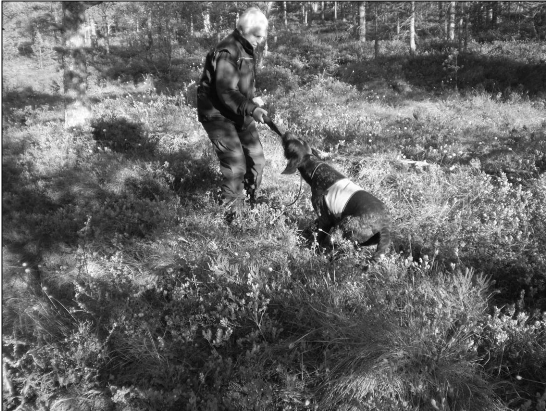
Birgit og Blixt