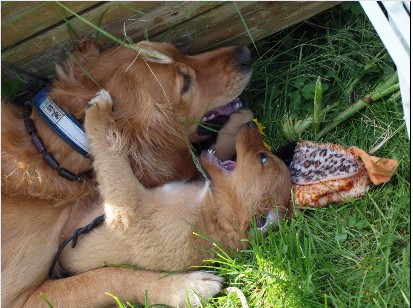
Jazz og Kijani