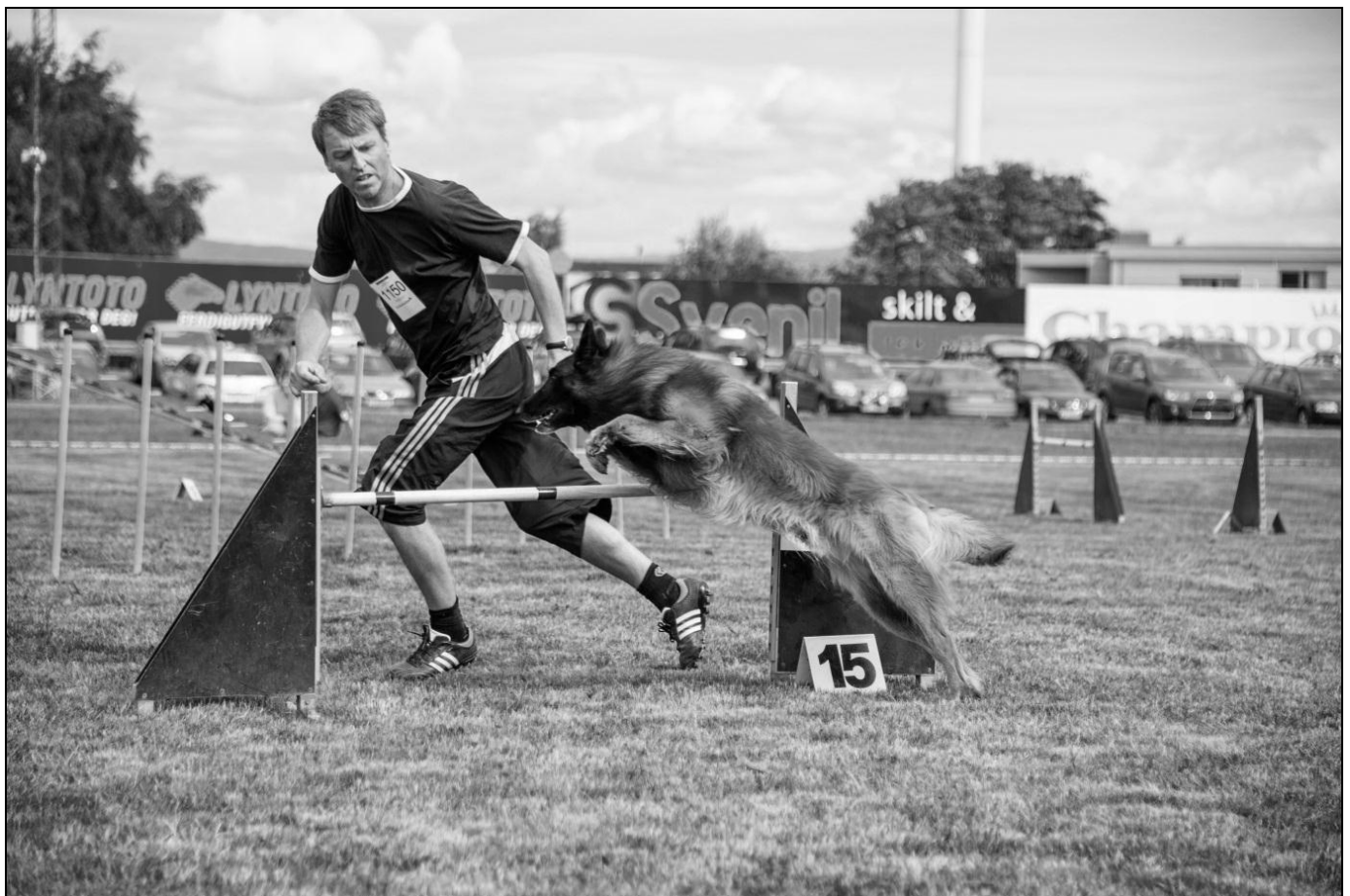
Helge og Amigo