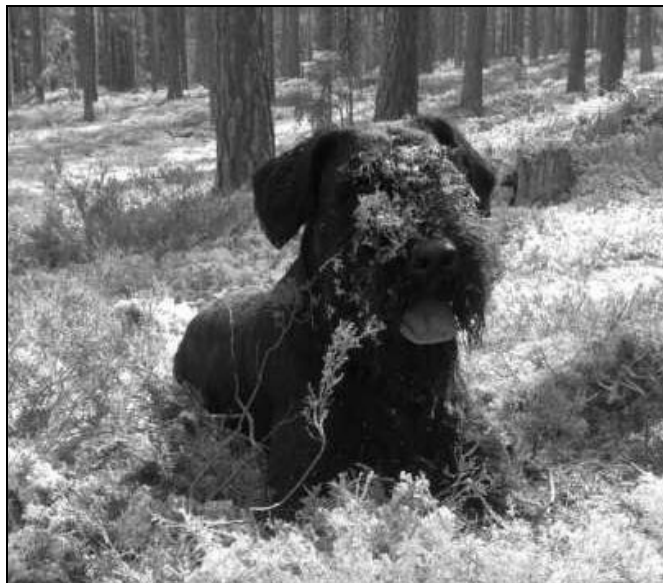
Denniz, en brukshund