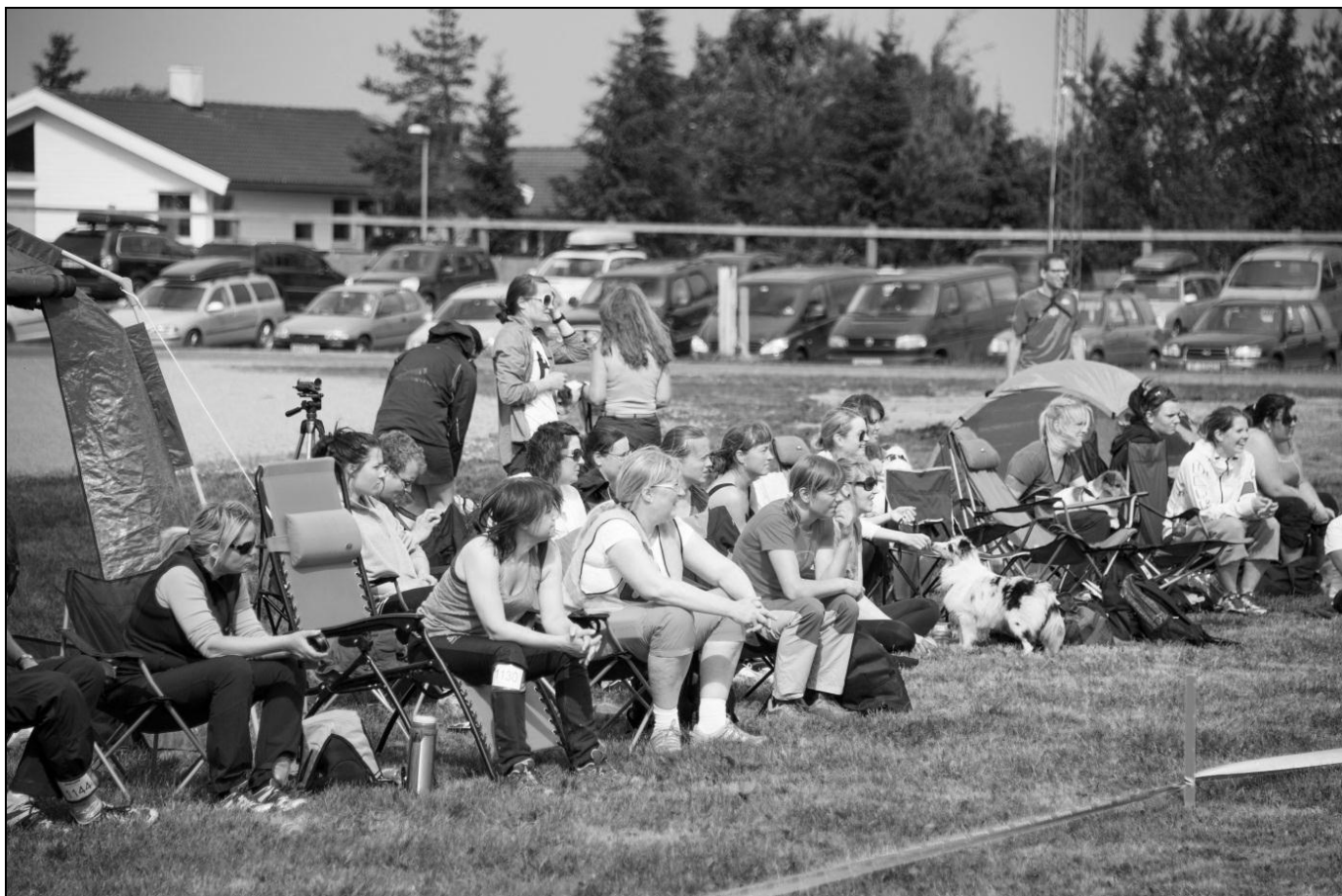
Spente tilskuere