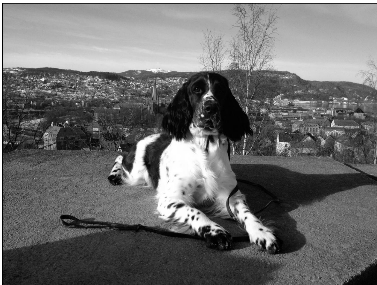
Desperados Bitten