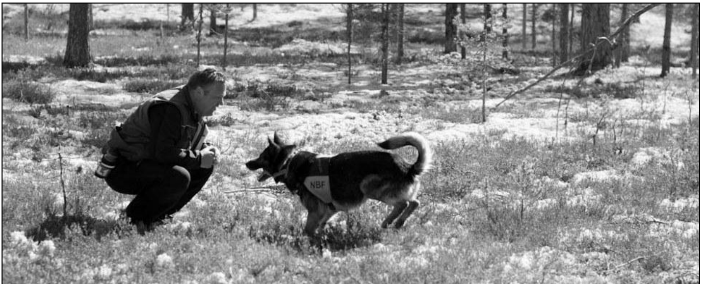
Bjørnar Strand og XO Axxe i runderingsløypa. Bjørnar blir veldig glad når Axxe kommer med bittet i munnen, som forteller at en figurant er funnet....